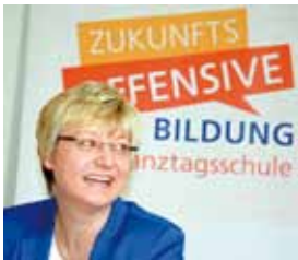
Frauke Heiligenstadt Niedersächsische Kultusministerin

Auf dieser Grundlage werden Sie eine fundierte Entscheidung für den weiteren Bildungsweg Ihres Kindes treffen können. Ein glückliches Kind, das den Anforderungen der gewählten Schulform motiviert begegnet, sollte das gemeinsame Ziel sein.